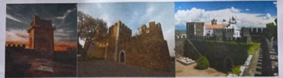
Castelo de Beja

O Castelo de Beja está localizado na cidade de Beja, no Alentejo.