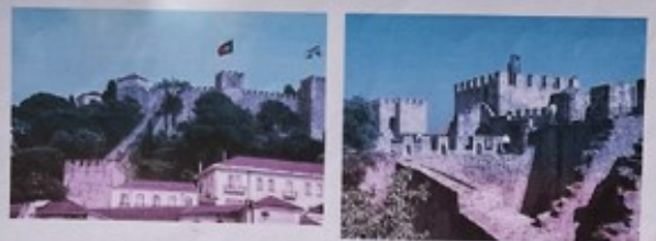
Castelo de São Jorge

O Castelo de São Jorge, antigo Paço de Alcáçova, localiza-se na freguesia de Santa Maria Maior (Castelo), na cidade e município de Lisboa, em Portugal.