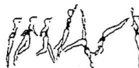
Salto de mãos à frente (10%)