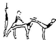
Posição de equilíbrio (avião, bandeira, etc.) (5%)