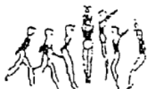
Corrida e salto em extensão com 1/2 volta (5%)