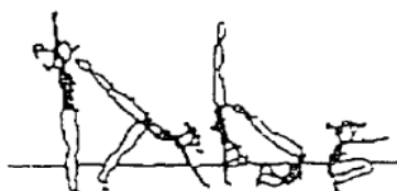
Apoio facial invertido, rolamento à frente (20%)

Construa uma sequência, com as diversas figuras, de forma a obter no mínimo 60 % de média do valor global dos elementos técnicos.